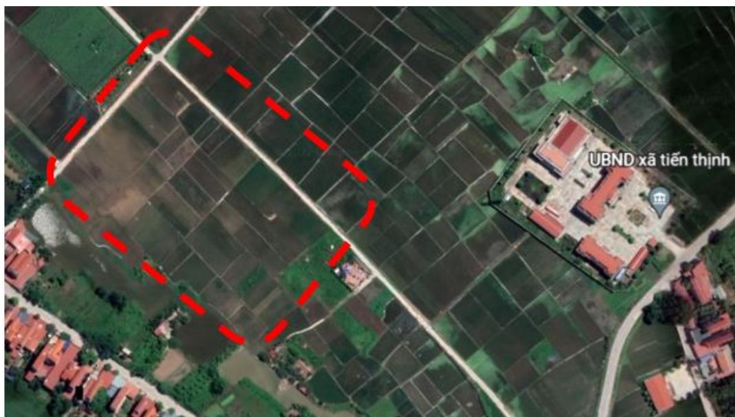
Hình 2. 1. Sơ đồ lấy mẫu môi trường nền