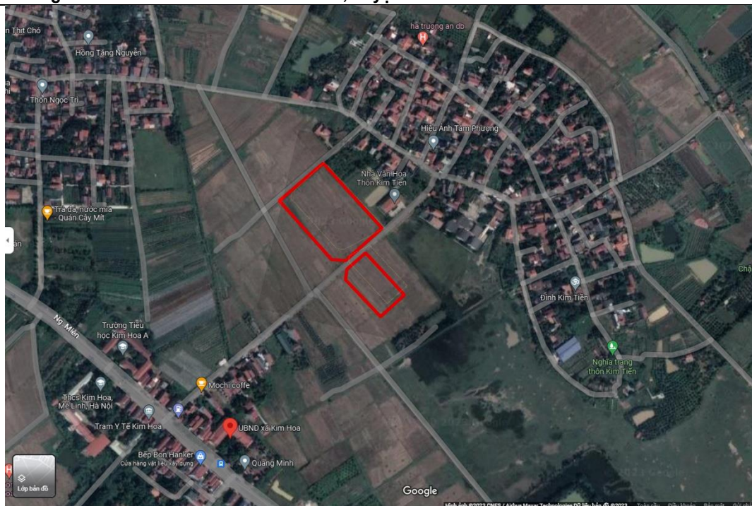
Hình 2. 1. Sơ đồ lấy mẫu môi trường nền